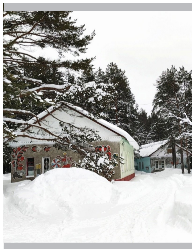
График заездов в 2025-м году: 13.01–30.01 (18д/16л.д.), 03.02–20.02 (18д/16л.д.), 04.03–20.03 (17д/13л.д.), 24.03–10.04 (18д/16л.д.), 14.04–30.04 (17д/15л.д.), май – ремонтные работы, 02.06–20.06 (19д/14л.д.), 23.06–13.07 (21д/18л.д.), заезд «Мать и дитя» – 21.07–10.08 (21д/18л.д.), 13.08–29.08 (17д/15л.д.), сентябрь – ремонтные работы, 06.10–23.10 (18д/16л.д.), 27.10–13.11(18д/14л.д.), 17.11–04.12 (18д/16л.д.), 08.12 –26.12 (19д/17л.д.).

Заполнить заявление можно в отделе социального развития (1 кабинет отдела кадров) или у председателей своих цехкомов. Информация по телефонам: 66-4-80, 3-99-86.