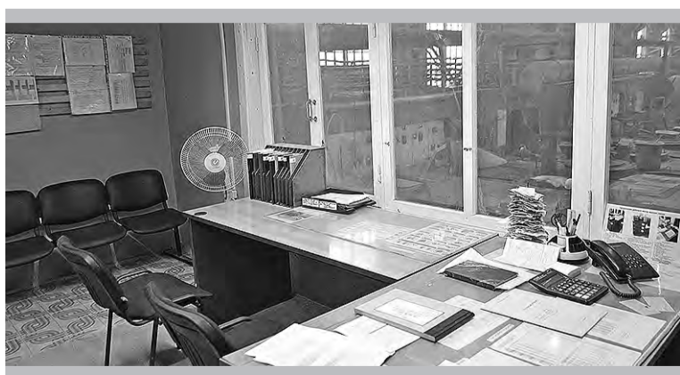
Комната мастера в третьем отделении цеха № 1