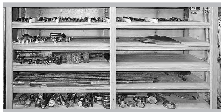
Каждая гайка — на своём месте

болтикам. Определились с набором инструментов.