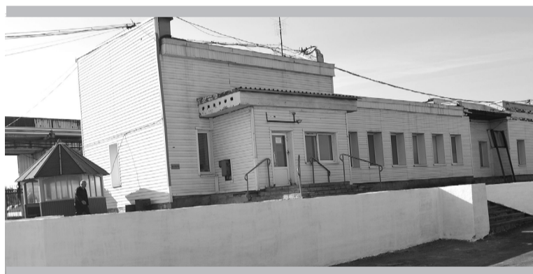
Новое бетонное ограждение проходной

металлической основы нового карналлитового хлоратора № 4.