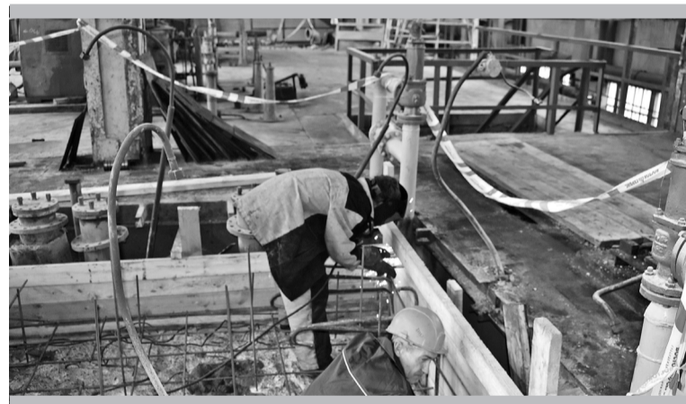
Создатели нового фундамента под аммиачный компрессор АХУ

В основном цехе № 4 мы первым делом проходим в