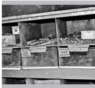
Каждый «болток» знай свой «шесток» (в мехмастерской цеха №1)