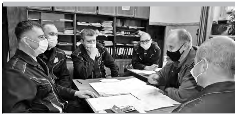
Заседание рабочей группы цеха № 4: всегда есть, над чем подумать