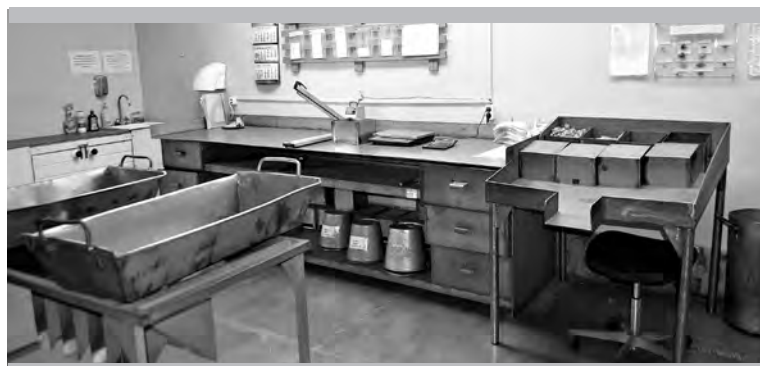
Рабочая зона (место подготовки проб) — один из полигонов проекта в цехе № 9