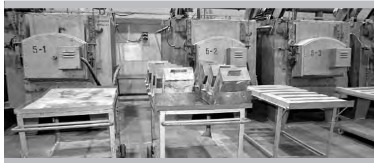
В рабочей зоне аммиачного гидролиза (цех №3) сейчас — только самое необходимое