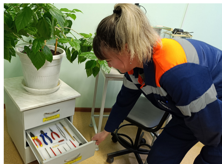
Кабинет аналитики цеха № 16

«Сначала вынесли железо, убрали весь завал – пожалуй, тонны три. Цех 26 выполнил ремонт, всё остальное сделали сами, –