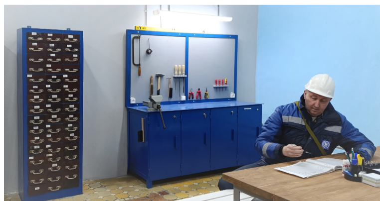
Слесарная мастерская цеха № 18