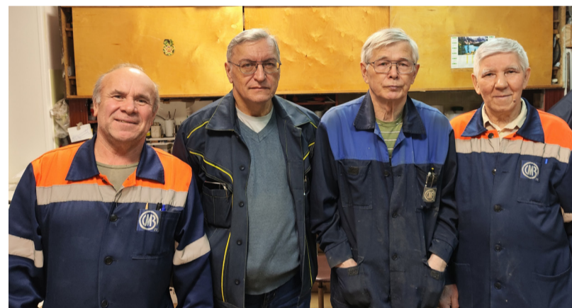
Кто скажет, что полвека позади?!

ческого обеспечения авиации в Тамбове и во внутренних войсках города Красноярска соответственно. Для каждого из них служба в армии стала не только исполнением воинского долга, но и хорошей школой по преодолению трудностей и испытаний, встречающихся на жизненном пути.